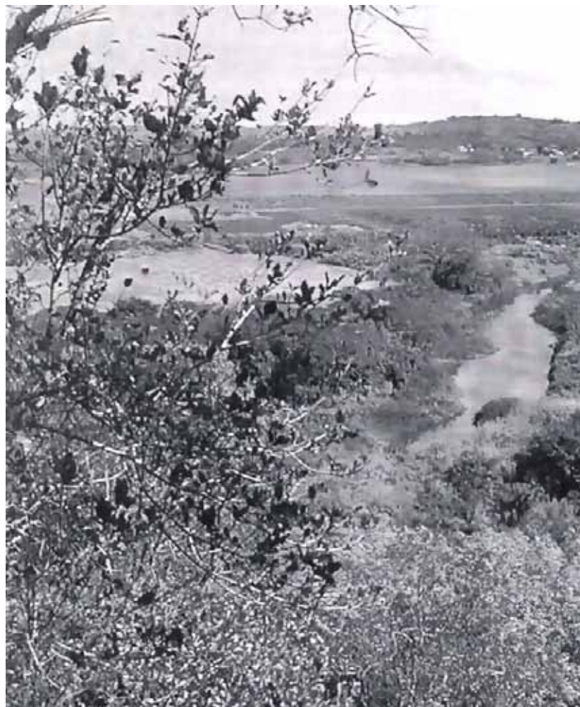
Vista del Arimao desde la abrupta ladera oeste de la Loma de Convento. Visión de la que Dios debió servirse para sugerir la Conversión del Padre Las Casas.