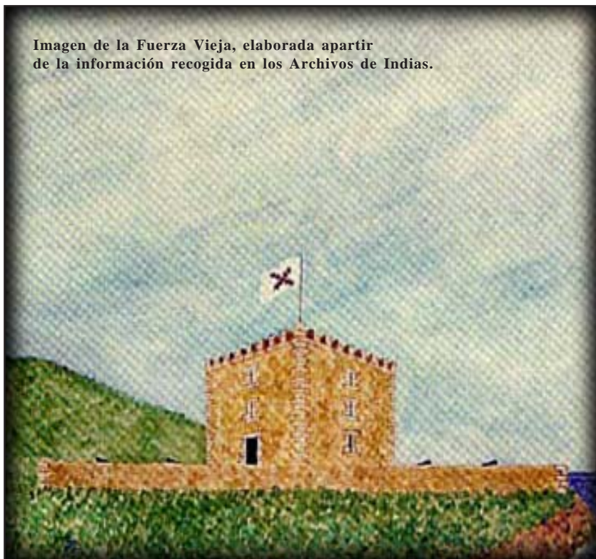
Imagen de la Fuerza Vieja, elaborada a partir de la información recogida en los Archivos de Indias.