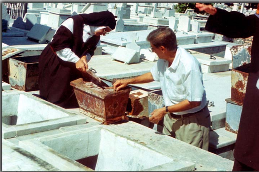
La vida de clausura de las madres carmelitas se vió interrumpida, y con sus propias manos una religiosa tuvo que poner orden en su modesto panteón también profanado. Un total de 26 osarios completos fueron vaciados.

– Llegué de Galicia en 1947. Yo era entonces un muchacho, y a los pocos días de mi estancia aquí comencé a trabajar con mi padre en la limpieza de panteones de este cementerio. Por aquella época el cementerio pertenecía a la Iglesia Católica, y había tremenda disciplina y se respetaba mucho el cementerio, aunque sólo había un celador. Con decirte que al que cogían saltando la cerca lo acusaban de profanación. Cuando en 1961 el cementerio pasó a ser administrado por el Estado las cosas siguieron bastante bien, hasta hace diez o quince años que comenzaron los robos en capillas y panteones, el saqueo de estatuas, las profanaciones y el registro de bóvedas en busca de prendas o dientes de oro que pudiera haber entre los restos. Pero no pasa nada.