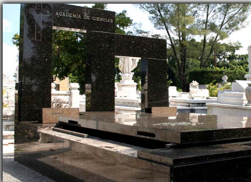
En este panteón de la Academia de Ciencias reposan los restos de André Voisin. En días pasados la tumba amaneció como se muestra: la tapa levantada y una pieza entera de mármol negro arrancada. Nadie vió nada.

El loable trabajo publicado por Tribuna de La Habana citaba algunas de las medidas adoptadas por la