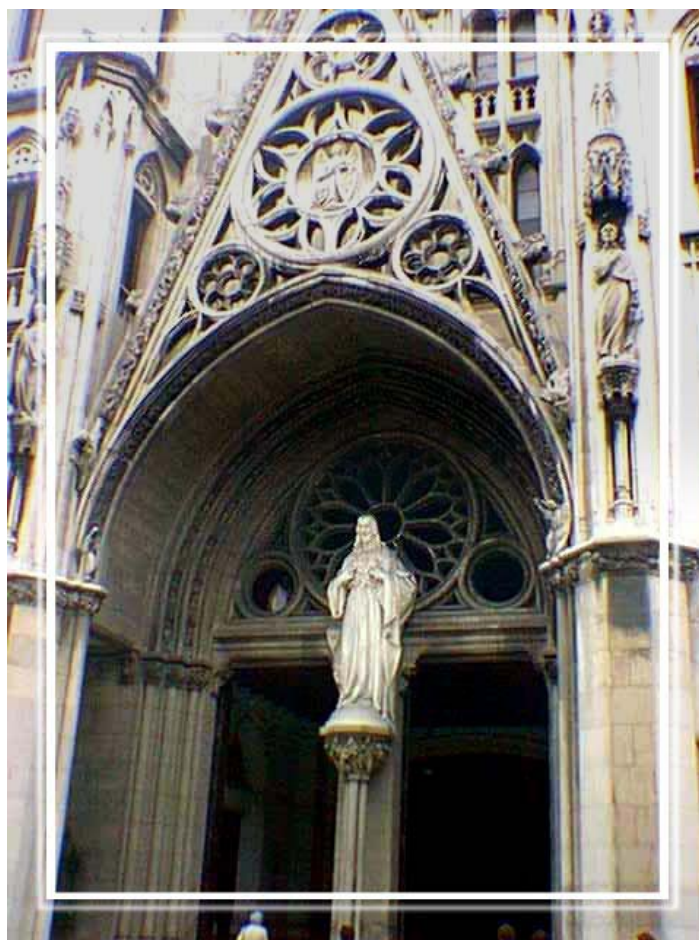
Un detalle frontal de la entrada y el frente de la iglesia de Reina, en Centro Habana, un templo que atienden los padres jesuitas.

En su lecho de dolor Ignacio había recibido los primeros elementos de la discreción de espíritus, para saber si un espíritu procede de Dios o de