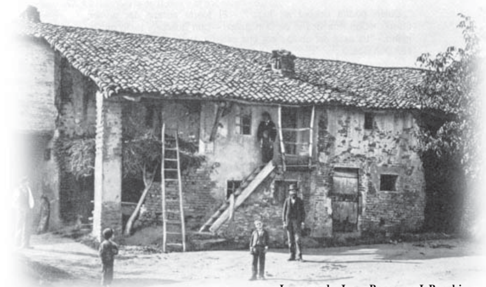
La casa de Juan Bosco en I Becchi.

Don Bosco siempre había tenido la idea de fundar una congregación religiosa. Por fin logró un pequeño grupo de