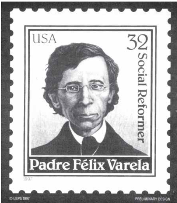
Sello cancelado en San Agustín, La Florida, año 1997.

E N ENERO DE 1821 EL Padre Félix Varela dejó de enseñar filosofía y se hizo cargo de la nueva Cátedra de Constitución en el Colegio-Seminario de San Carlos, en la ciudad de La Habana. Este aspecto del magisterio del padre Varela es poco conocido. Sin embargo, su contribución al desarrollo del derecho constitucional y su defensa de los derechos humanos frente al despotismo regio y la tiranía estatal tuvo una gran repercusión en la conciencia de la naciente nación cubana. En verdad, aquella Cátedra de Constitución fue donde el padre Varela proclamó por primera vez en Cuba el carácter inalienable y sagrado de los derechos humanos. Allí fue donde defendió con claridad y valentía el derecho de los pueblos a tener su libertad y a elegir sus propios gobernantes. Allí fue en fin donde sembró las ideas políticas que más tarde habrían de conducir inevitablemente a la lucha por la independencia de Cuba.