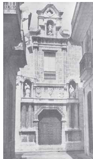
Calle San Ignacio esquina a Tejadillo. puerta lateral del Seminario San Carlos y San Ambrosio (antigua portada principal).

Precisamente, porque el hombre nace libre, la autoridad pública debe ser constituida mediante la elección o el libre consentimiento de la mayoría de los ciudadanos. Cualquier otro título que pretenda suplantar el derecho de elección directa o indirecta de los gobernantes debe considerarse ilegítimo e injusto según el padre Varela. En su Cátedra de Constitución enseñó explícitamente que nadie tiene derecho irrevocable a gobernar a título de herencia o de conquista. También rechazó las doctrinas que él llamaba “celestiales”, según las cuales los reyes ejercen por derecho divino el poder absoluto, con carácter irrevocable, como si lo hubieran recibido directamente de Dios. Él reconocía que, de acuerdo con la Biblia y la tradición de la iglesia, es cierto que de Dios proviene todo poder; pero advertía sabiamente que para que el poder y la autoridad sean legítimos deben ser transmitidos de acuerdo con la naturaleza y dignidad del hombre, que es libre, inteligente y sociable por voluntad divina. “Jamás se diga, escribía el padre Varela, que un Dios justo y piadoso ha querido privar a los hombres de los derechos que Él mismo les dio por naturaleza, y que erigiendo un tirano los ha hecho esclavos. El lenguaje de la adulación será distinto, pero este es el de la verdadera religión” 6 .