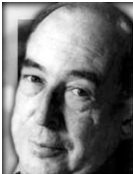
Clive Staples Lewis

Somos herederos de la actitud desconfiada del cartesianismo, que no admitía ninguna otra evidencia primordial que la del sujeto en cuanto pensante y de ella quiso extraer con la razón toda