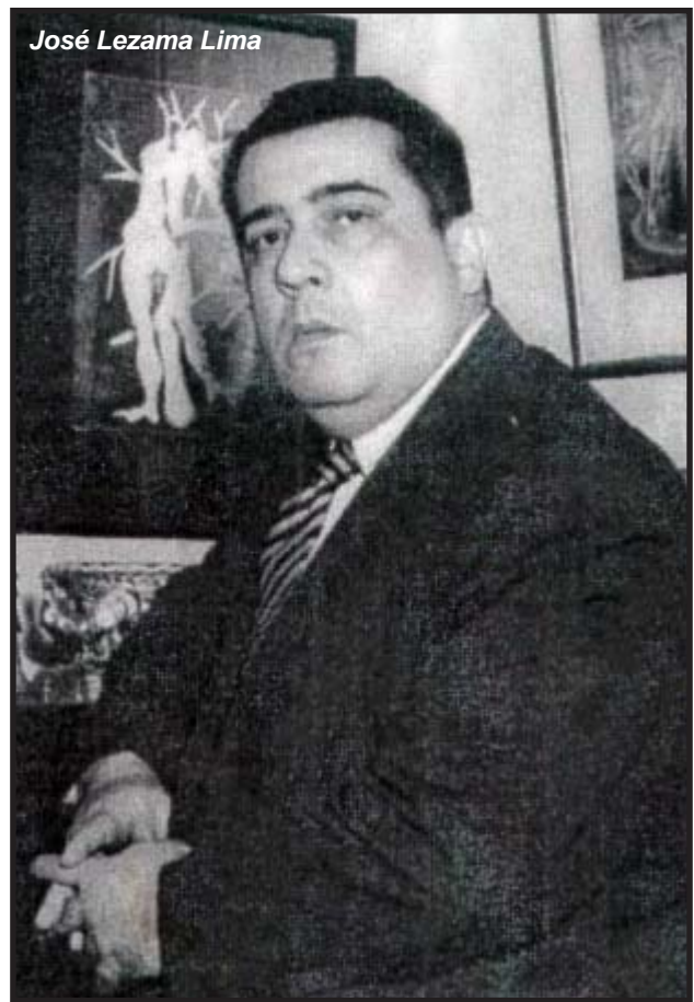
José Lezama Lima

11.- ¿Solamente superficialidad coyuntural, o asoma por detrás una carencia cultural sostenida, con repercusión en la vida religiosa? Cintio Vitier afirma que lo cubano "nos da la ima-