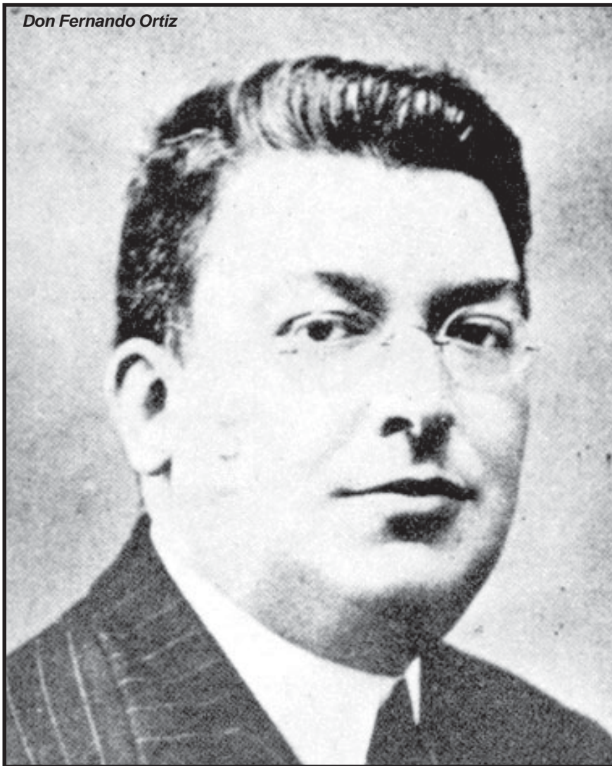
Don Fernando Ortiz

tas de pie, armados por la razón iluminada, pero que no por ello deja de ser un misterio impenetrable y, simultáneamente, beatificante. Por otra parte, la fe que ignora la razón se reduce a actitudes sentimentales, sin sustancia ni proyección universal, cuando no a conceptualización delirante de mitos que no toman en consideración las exigencias de la naturaleza humana y, por ende, son ajenos a la economía de la encarnación –propia del Cristianismo-