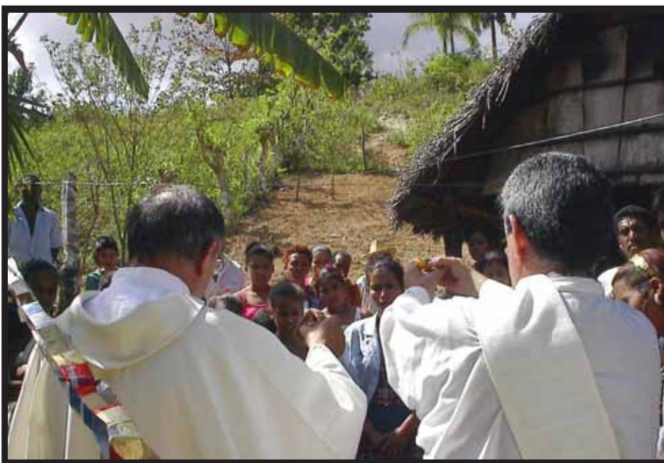
Celebración Eucarística en las lomas de Guantánamo.

La semilla del Padre Pastor cayó en tierra buena y ahí están los frutos: esos hombres y mujeres de Iglesia que saben situar las cosas en su lugar. Al recorrer rápidamente la historia de la Iglesia en nuestra República, reconocen el valor de lo político y de las demás realidades existenciales, “terrenales”, pero tratando de asuntos eclesiales, como era el caso, no caen en las trampas de las hiperconcentraciones en el ámbito político circunstancial, trampa en la que