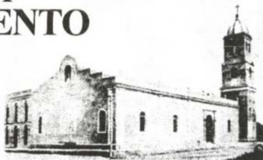
CATEDRAL DE BAYAMO

Mis primeras sorpresas tuvieron lugar, sin embargo, en las mismas conferencias previstas. Yo esperaba un auditorio de treinta o cuarenta personas, en el que predominarían nuestras buenas ancianas parroquiales. En todas, el número de participantes pasó de los ciento cincuenta; me da la impresión de que la noche valeriana rompió el récord: no creo exagerar si afirmo que había más de doscientas personas en el templo -ahora Catedral- del Santísimo Salva-